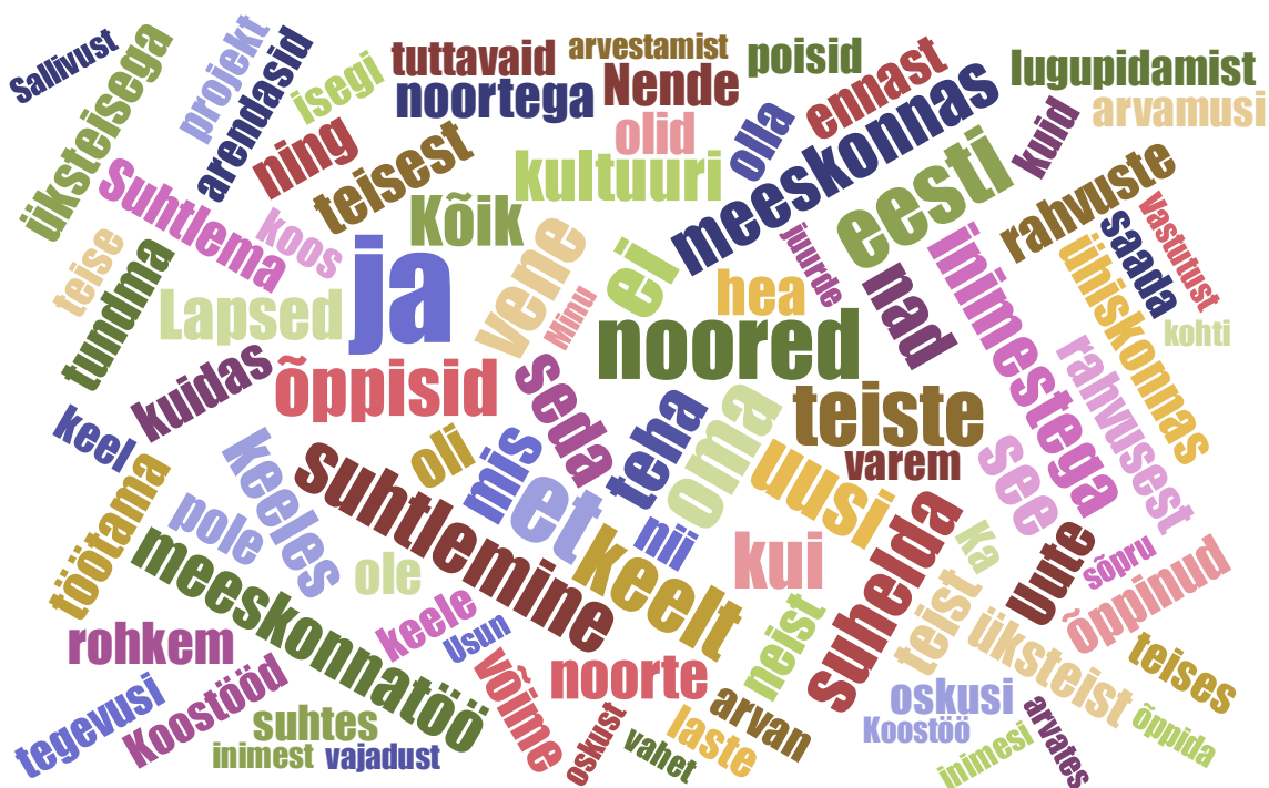
Joonis 3. Sõnapilv. Pilootaasta küsitluse noorteuhiite vabad vastused küsimusele “Andke oma hinnang, mida noored noortekohtumises osalemise kogemusest kõige rohkem õppisid?”

Noortekohtumistes on noorteuhiitel ja noortel väga suur vabadus projekti sisu kavandamisel lähtuvalt enda huvidest. Sõltuvalt projektist on nii projektide aruannete kui intervjuude kohaselt õpitud mitmeid projekti teemaga ja üldiselt elus hakkama saamisega seotud praktilisi oskusi, näiteks ellujäämisoskus looduses, keskkonnateadlikkus, terviseteadlikkus, esmaabivõtted, isikliku hügieeni eest hoolitsemine, toidu valmistamine, uued spordialad. Projekti teemadega seotud oskuste kõrval on PNK panustanud märkimisväärselt ka noorte võtmepädevuste arengusse. Järgnevalt ongi toodud vastavaid näiteid, kusjuures täpne panus sõltub uuringule tuginedes noorteuhiite, projekti teemast, valitud tegevustest ja nende korraldusest ning programmis osalevate noorte vanusest ja sellest, mitmendat korda noortekohtumistes osaletakse. Iga alapeatüki alguses on toodud noorte võtmepädevuste selgitused. PNK panust hinnatakse, tuginedes pilootaasta küsitluse tulemustele (peegeldab ühe noortekohtumise esialgset mõju), 2015.–2018. aasta projektide aruannetele (kajastab ühe noortekohtumise projekti esialgset mõju, sõltuvalt projektist 1-3 kohtumist) ja käesolevas uuringus tehtud intervjuudele (noorteuhiite puhul mitme noortekohtumise projekti panus). Noorte pädevuste arengut ilmestab joonis 3.